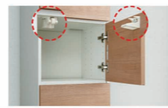
感知式ロック機構付き収納

田島興産にはお金のプロフェッショナル、 ファイナンシャルプランナーがいます♪ 気になることはお気軽にご相談ください。